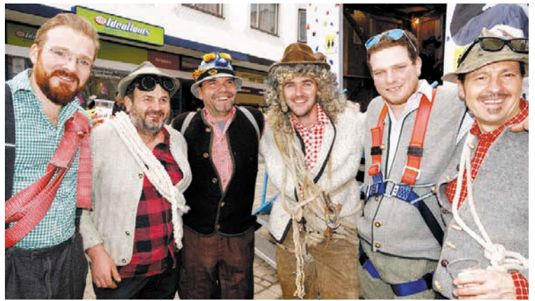
Ganz auf ihren Wagen abgestimmt erschienen die Laninger im Bergsteigeroutfit als echte Tiroler Naturburschen.

(AR) Zum Ausklang des Faschings ging es am Untermarkt in Telfs noch einmal mal hoch her. Waren die Jungbauern und ihr Wagen im Styling von „Mignons“ aufgefahren, so hatten die Faschingsgruppen der Schleicher und Laninger in Kooperation mehrere Labe-Stationen aufgebaut und sich ganz dem Wahlthema verschrieben. Neben dem unvermeidlichen Bierstandl konnten das Publikum den Wagen, getarnt als Kletterwand für Bürgermeisterkandidaten erkraxeln, humorig gestaltet mit lebensechten Fotos der sechs Anwärter auf den Gemeindestuhl und einem „I trau mi nit...“ – Statement für Christoph Stock. Passende