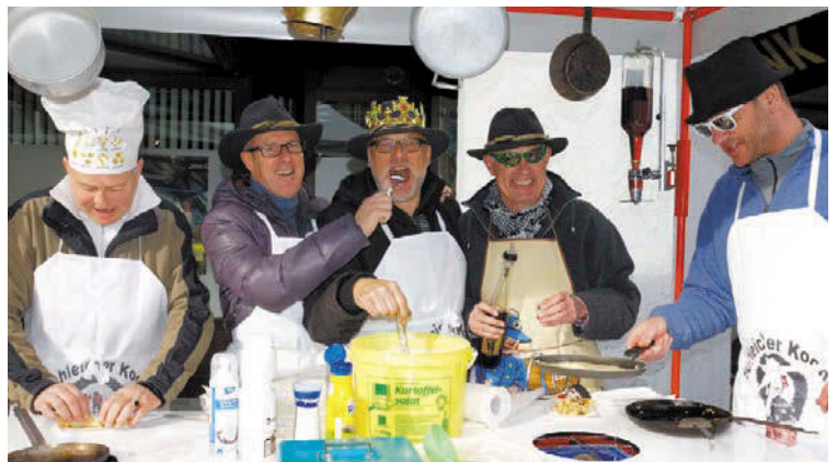
Wenn der Schmarrn nit schmeckt! Die vielen Schleicher-Köche verdarben diesen Brei jedenfalls nicht!